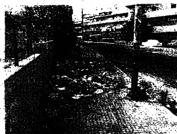
انتقليات على وصف الشارع

ويقول سكان المنطقة انهم يتعمرون كل شبه ، كتحريم لا يهون ان يحكم على منطقة سكنية في صيدا ويقطعها لاسماء صيدا الذين يهاجرونهم كلها ضمن نطاق صيدا البلدي ، وان يعيشوا وسط المسؤولين في بلد صيدا والمية ومية ، حول تحسين اوضاعهم الصحية ، وقدوا ان الخلف الذي كان مستترا بين البلدين حول اعمال التنقيح في الشوارع الملائية الى القيلات قد انتهى ينولي المحفل رئاسة البلديين ، على اعتبار انها من البلديات المتحللة بفضاء صيدا . . . . . لكنه حتى الان وبعد مرور اكثر من سنتين فان ما حصل كان مخالفاً لتقنين هؤلاء المواطنين . فقد استمرت الحالة كما كانت من قبل : الاوضاع تسد الاجاري التي اقيمت على جانبي الطريق لتصريف مياه الاطيار ، والشوارع اصبحت مكاناً لتجول المواشي ، وبؤرة للقذورات .